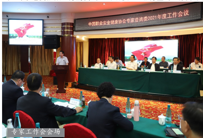
专家工作会议会场

线、艰苦奋斗的优良作风”。前面那一条是坚定信念,后面这一条是要艰苦奋斗。这对我们协会太有意义了。下一个五年计划我们想再造一个协会,不管前面有千难万险,我们一定要坚定“再造一个协会、坚定创世界一流”这个信念。我们再苦再难那跟井冈山当年那个情景没法比,所以我们一定要发扬井冈山精神、发扬艰苦奋斗的优良作风,实现我们的宏伟目标。这还得依靠专家的力量。因此,我希望我们要进一步把专家工作、特别是各专家组的工作谋划好,专家组的设置要根据协会发展需要而设。三是队伍结构还不十分适应。现在专家是又多又少,100多人不少了,但真正用时又不够。主要是专业结构需调整加强,还需要继续缺什么补什么、差什么强什么、少什么添什么。专家也要根据业务需要而