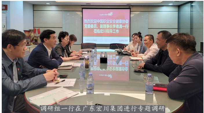
调研组一行在广东宏川集团进行专题调研

量,党建工作对于民营上市公司高质量发展具有非常重要的意义,必须在新发展阶段,牢牢贯彻新发展理念,推进民营企业在完善公司治理中加强党的领导,以党建为引领,以改革为动力做强做优做大,为建设社会主义现代化强国贡献力量。