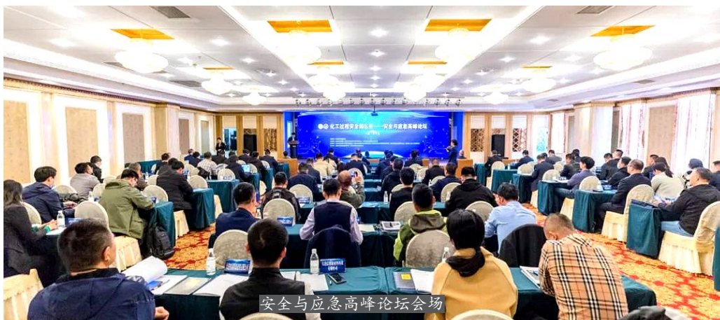
安全与应急高峰论坛会场

本次论坛由大连长兴岛经济技术开发区应急管理局、大连长兴岛经济技术开发区投资促进局、大连西中岛石化工业基地发展有限公司、大连长兴岛科创企业服务有限公司、思弘正安(北