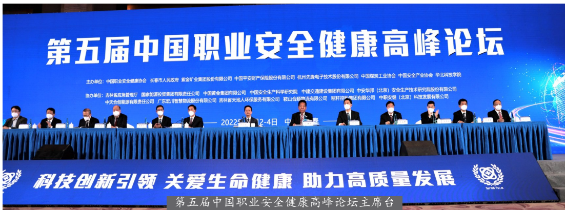
第五届中国职业安全健康高峰论坛主席台

具有伟大历史意义的中国共产党第二十次全国代表大会刚刚闭幕,11月3日上午,第五届中国职业安全健康高峰论坛暨第四届东北亚(吉林)安全应急产业博览会在吉林省长春市拉开了帷幕。本届论坛的主题是“关爱生命健康、科技创新引领、助力高质量发展”。