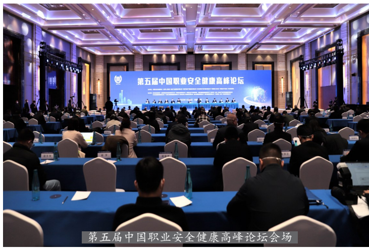
第五届中国职业安全健康高峰论坛会场