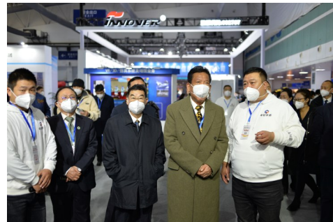
关注焦点——安全防护与装备介绍