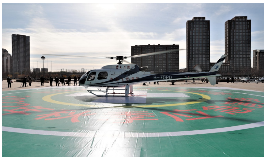
振翅欲飞——直升机成为应急救援的大型装备