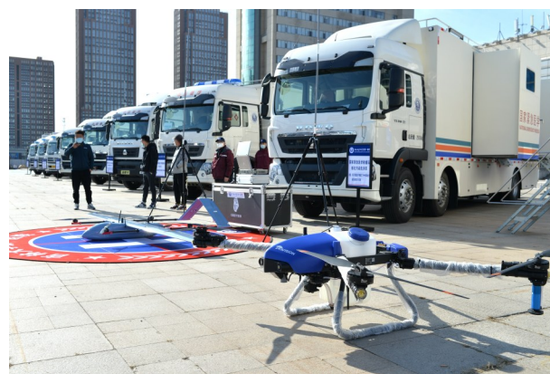
重型装备——核化污染洗消专业车辆