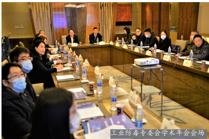
工业防毒专委会学术年会会场

长期损害子代神经发育的胎盘病因机制研究》为题、解放军总医院第五医学中心中毒救治科