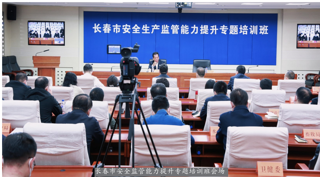
长春市安全监管能力提升专题培训班会场

11月5日,长春市委市政府举办区(县、局)级正职领导干部安全生产监管能力提升专题培训班,中国职业安全健康协会党委书记、理事长王德学受邀出席,并发表《坚持以人为本 推动安全发展》主旨演讲,结合自己的学习体会和多年工作经验,领习近平总书记关于安全生产和应急管理方面的一系列重要论述及批示指示精神(以下简称重要论述)。长春市政府副秘书长李雪峰主持开班仪式,