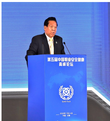
演讲主题——创建职业安全健康企业